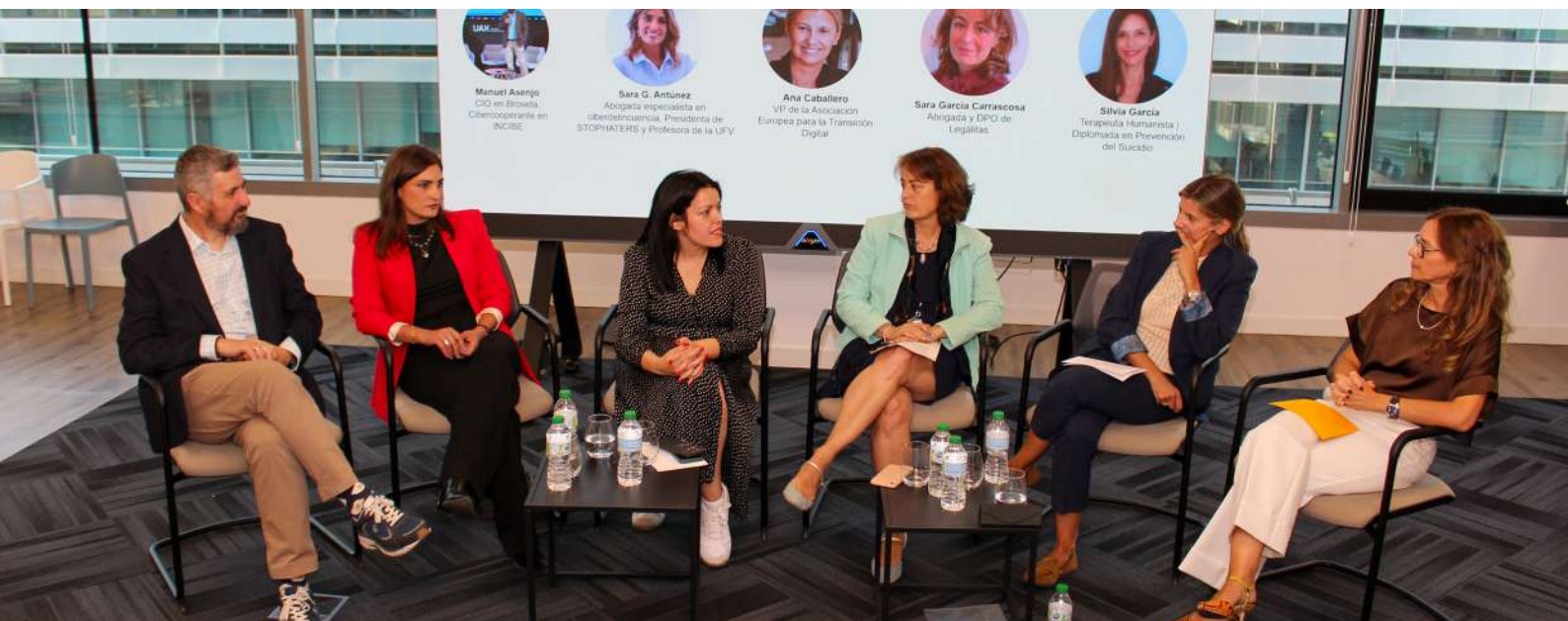
Momentos de la charla sobre ciberacoso organizada por Legal Hackers en las oficinas de Legálitas.