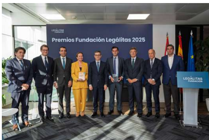
Momento de la entrega de los premios "Fundación Legálitas".

El premio a la 'Mejor Iniciativa de Divulgación Jurídica' de esta edición fue para la Real Academia Española, un galardón que reconoce la trayectoria de una institución histórica comprometida con el buen uso y la unidad del idioma. La RAE también ha trabajado en la evolución del lenguaje dentro del sector legal, publicando en 2016 el primer Diccionario del español jurídico.