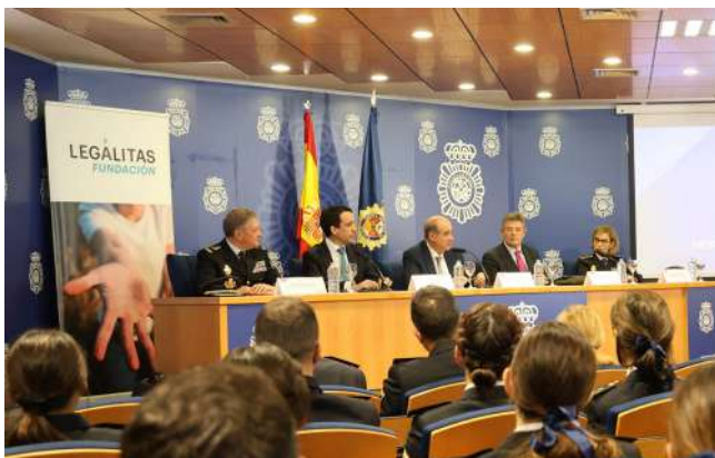
Momentos de la presentación de la campaña “Mantente alerta”.

La campaña, que tenía como objetivo sensibilizar a la ciudadanía sobre la existencia y el impacto de las ciberestafas, consta de tres vídeos que reflejan la vulnerabilidad de los ciudadanos ante posibles fraudes online cuando hacen uso de sus dispositivos tecnológicos. A través de situaciones cotidianas, las piezas muestran algunos de los mensajes más habituales utilizados por los ciberdelincuentes en internet y redes sociales, como promesas de “dinero fácil” o supuestas inversiones en criptomonedas, con el fin de engañar a las víctimas, obtener sus datos personales o bancarios y cometer delitos.